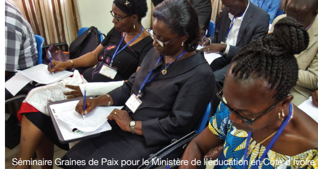
Séminaire Graines de Paix pour le Ministère de l'éducation en Côte d'Ivoire

Cela comprend un dictionnaire de mots-clés sur la paix et l'éducation, des citations et proverbes classés par thématique scolaire, des contes et des sketches de paix, de l'humour, de l'amusement et plus encore.